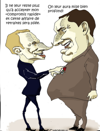
MACRON DÉCORE CIRELLI, PATRON DE BLACKROCK FRANC